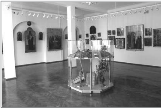
Музейна зала «Сакральне мистецтво»