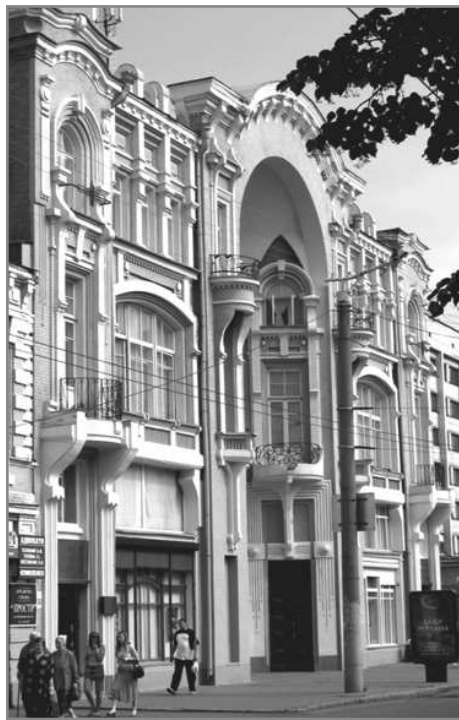
Кіровоградський обласний художній музей

Історія створення музею почалась наприкінці XIX століття, коли у 1870 році представники передової інтелігенції поставили питання про створення в місті художнього музею. Але лише в 1921 році була створена картинна галерея, яка в 1924 році ввійшла до складу природничо-історичного музею. В 1926 році зібрання галереї налічувало 150 експонатів, з них 26 оригіналів, які були зібрані в дореволюційні роки, а також пожертвовані любителями мистецтва. Повністю розграбована під час фашистської окупації, картинна галерея, відродилася у 1965 році, і стала відділом обласного краєзнавчого музею. Картинна галерея була розташована в приміщенні Свято-Преображенської церкви, але, в 1991 році, після повернення церкви віруючим галереї було виділено інше приміщення пам'ятки архітектури. Будинок був побудований на