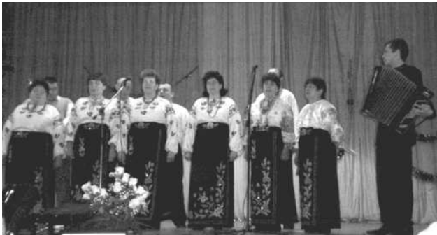
Концерт у Баландинському будинку культури