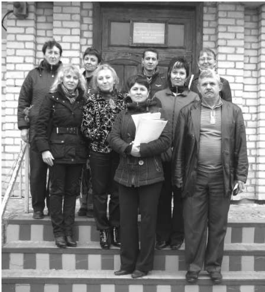
Команда проекту «Я+Ти=Ми»

заходів). Планування ж діяльності, спрямованої на спільне вирішення зазначеної проблеми, використовуючи потенціал кожної з організацій, спираючись на її сильні сторони,