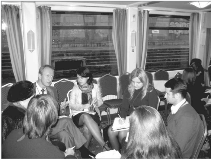
Учасники Конференції під час роботи у групах

впровадження реформ для якісних суспільних змін. За допомогою цього формату учасники конференції проаналізували ті знакові події, що відбулися у світі, в середовищі організацій громадянського суспільства.