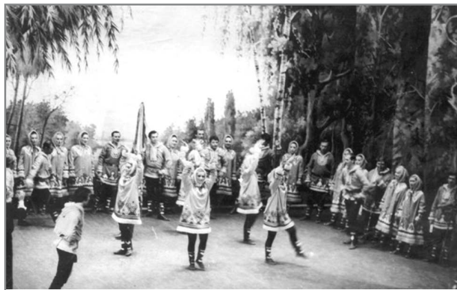
Чергове свято для сільської громади

Мені дуже прикро, що зараз зовсім все не так, не та культура, не та молодь... засмучує те,