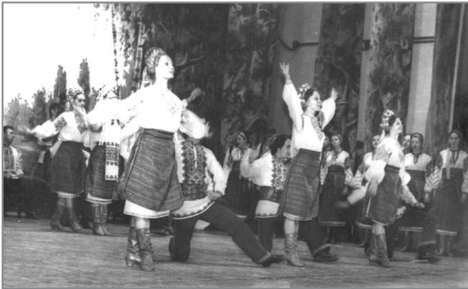
На сцені - танцювальний колектив будинку культури