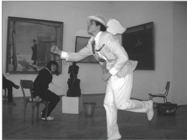
Черговий музейний “інтерактив”

— Є проект досить зрілий — «Музичні зустрічі в музеї». Раз на місяць в нашому концертному залі виступають відомі й не дуже, дорослі і дитячі (але завжди цікаві) музичні колективи. На фоні музейної виставки, музика сприймається зовсім по-новому, глибше. До того ж, у нас концерти — це не тільки музика, це