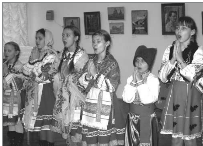
Учасники «Музичних зустрічей»

У нас час від часу проводяться різні майстер-класи: і гобеленове мистецтво, і кераміка, і виготовлення ляльок-мотанок. Мрію закінчити ремонт, щоб було місце розмістити художній салон, майстерні, де виготовлялись би якісь сувеніри. Можна розвиватися і розвиватися! І заробляти гроші, і головне — нести у суспільство культуру, духовність і красу, яка, я переконана, все одно врятує наш світ тому, що